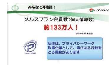
社内個人情報保護教育テキストより

また、GDPR(EU一般データ保護規則)に対応するとともに、子会社においても当社と同等の個人情報保護水準となる「メニコングループ個人情報保護規程」の整備を行っています。